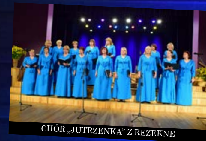
CHÓR „JUTRZENKA” Z REZEKNE