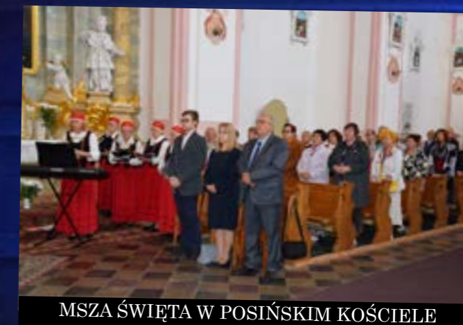
MSZA ŚWIĘTA W POSIŃSKIM KOŚCIELE