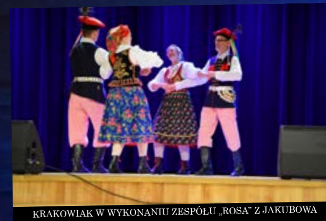
KRAKOWIAK W WYKONANIU ZESPÓLU „ROSA” Z JAKUBOWA