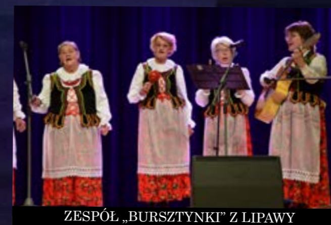
ZESPÓŁ „BURSZTYNKI” Z LIPAWY