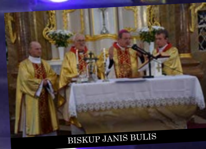
BISKUP JANIS BULIS