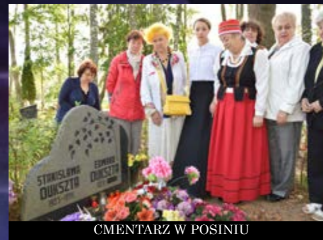
CMENTARZ W POSINIU

Zgodnie z tradycją, festiwal zakończyło uroczyste odśpiewanie „Roty” oraz spotkanie integracyjne.