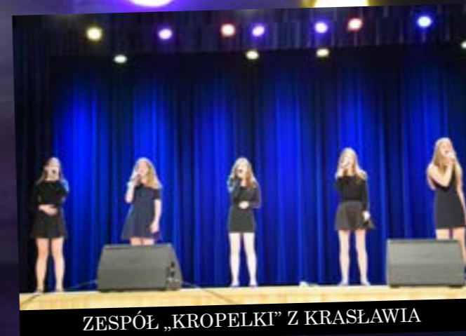
ZESPÓŁ „KROPELKI” Z KRASŁAWIA